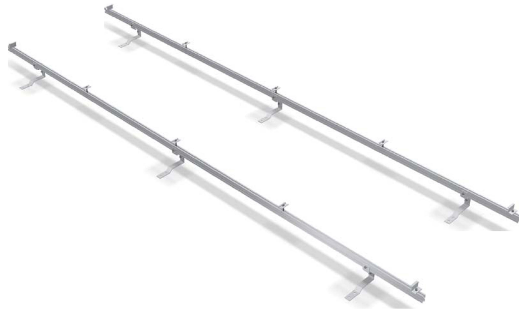
Estructura formada por perfiles RCVE 4.0 y fijación kit salvatejas