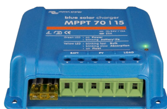
Controlador de carga solar MPPT 75/15