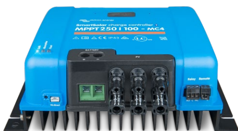
Controlador de carga SmartSolar MPPT 150/100-MC4 Sin pantalla