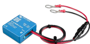
Detección de Bluetooth: Smart Battery Sense