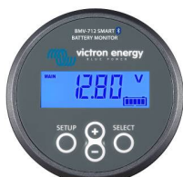
Detección de Bluetooth: BMV-712 Smart Battery Monitor