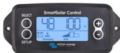
Pantalla enchufable SmartSolar

Simplemente retire el protector de goma del enchufe de la parte frontal del controlador y conecte la pantalla.