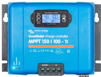
Controlador de carga SmartSolar MPPT 150/100-Tr Con pantalla conectable opcional.